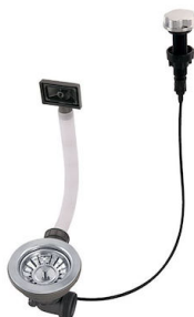
Automatischer Abfluss 8407 000