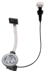
Automatischer Abfluss 8407 100