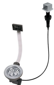
Automatischer Abfluss LIRA 8407 103